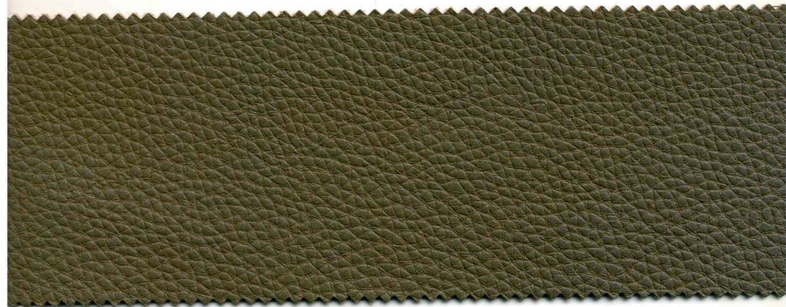
30 - visone