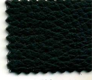
620 - nero