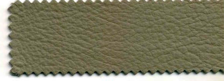
181 - tortora