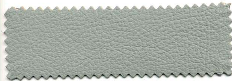
199 - grigio perla