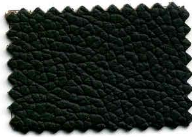
696 - moka