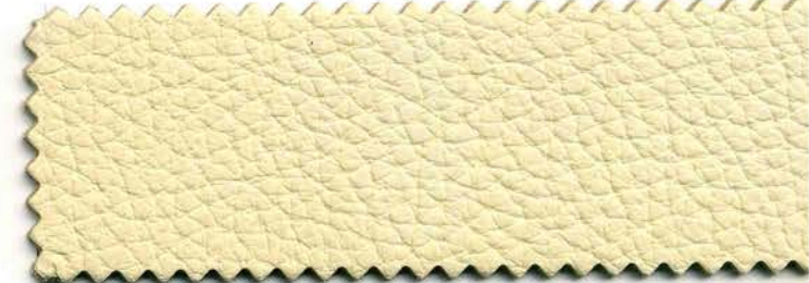
117 - vaniglia