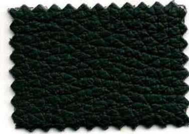
177 - grigio scuro