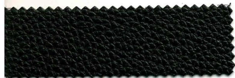
84 - moka