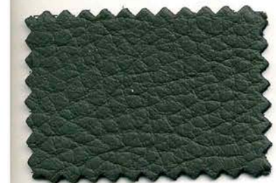
630 - grigio