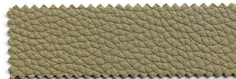
21 - tortora