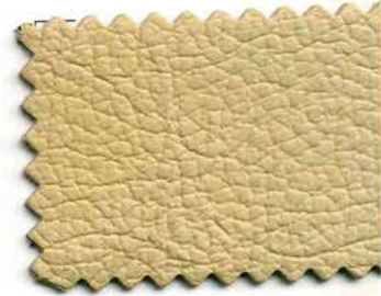
1379 - crema