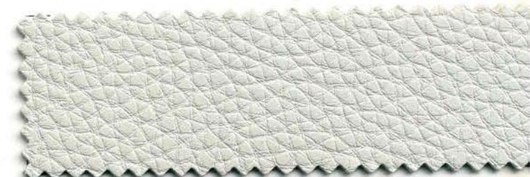
29 - grigio