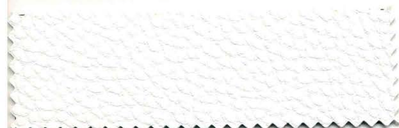
01 - bianco