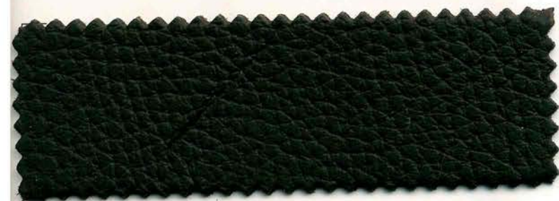
600 - testa moro