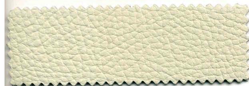
119 - beige