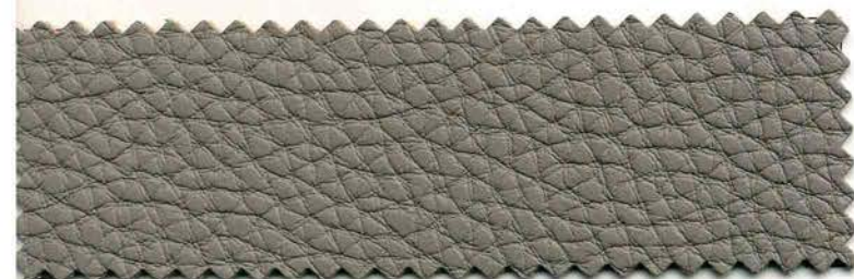
80 - fango