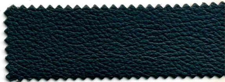
140 - blu notte