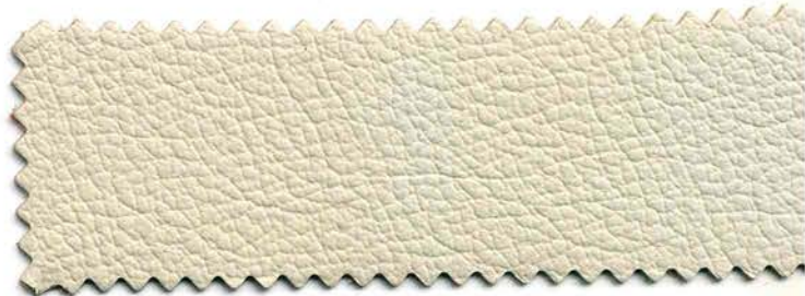
79 - torrone