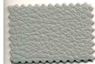
197 - grigio chiaro