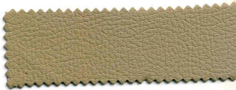
114 - tortora caldo