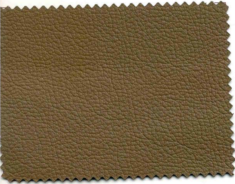
160 - corteccia