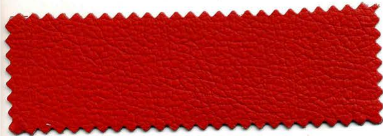
150 - rosso