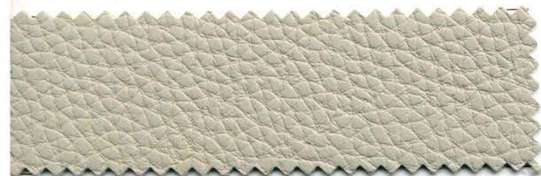
71 - tortora chiaro