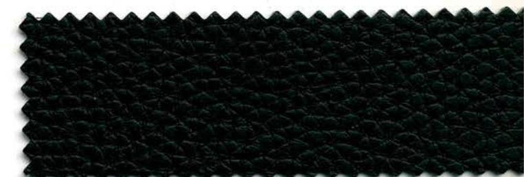
22 - nero