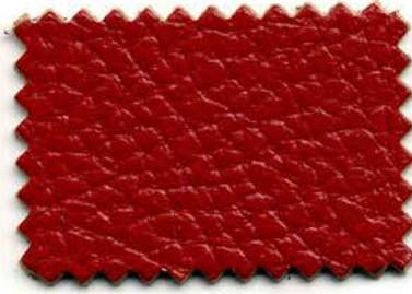
6185 - rosso