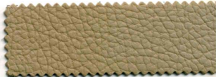
114 - tortora caldo