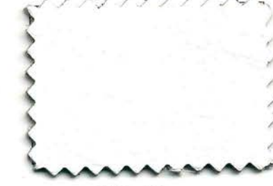
500 - bianco