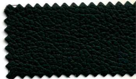
110 - nero