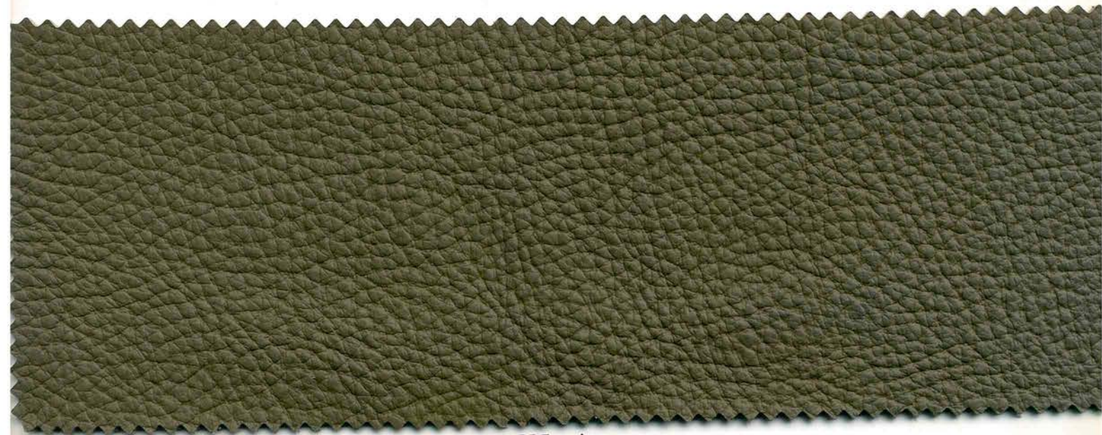
115 - visone