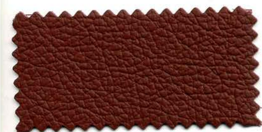
130 - bordeaux