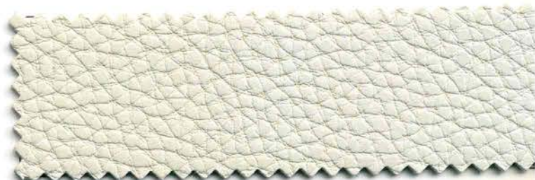
60 - beige