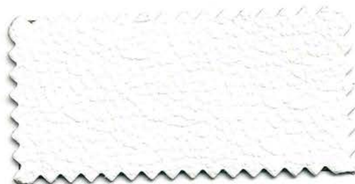
100 - bianco